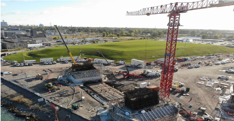
Los avances continúan en el emplazamiento del puente en Canadá